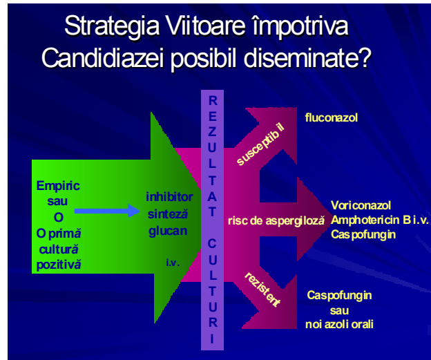
Fig.2 Dezescaladarea în terapia antimicotică

• când 40% din doza de antibiotic liber plasmatică depășește CMI-ul bacteriei în decursul a 24 de ore atunci rezultatul este bactericidie